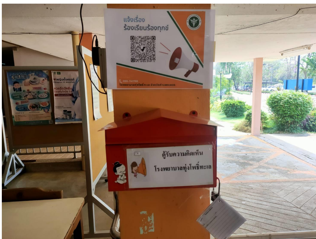
ตู้รับฟังความคิดเห็นบริเวณตึกPCU