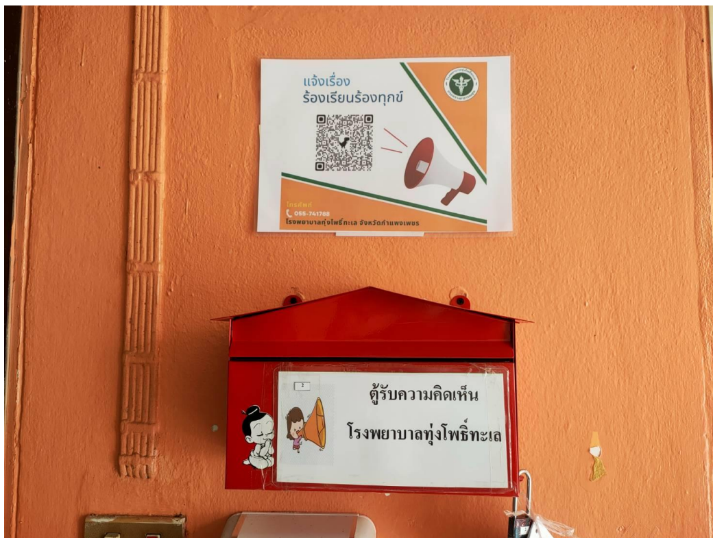
ตู้รับฟังความคิดเห็นบริเวณตึกผู้ป่วยใน